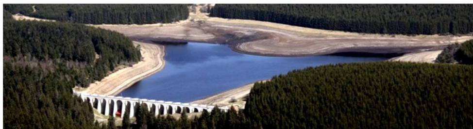
Photo: ci-après KKB - Barrage Pradeaux-Grandrif Birseck Hydro SAS - Auvergne (F)