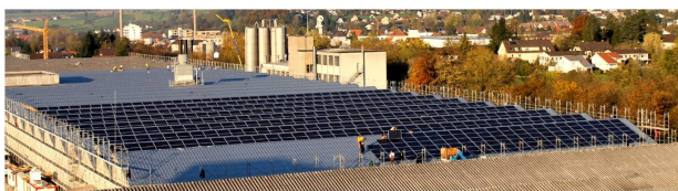
Photo ci-dessus: KKB - PV Solar Project Von Roll Breitenbach en développement